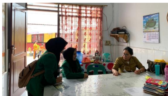
Gambar 3. Dokumentasi Wawancara Guru

pembelajaran sudah berjalan lancar. Namun pemahaman siswa terhadap materi bilangan rasioal belum baik. Siswa tidak memiliki motivasi dalam mengikuti proses pembelajaran walau penggunaan bahan ajar dinilai guru kelas V-A sudah maksimal. Proses pembelajaran tidak kondusif walau sudah digunakan model-metode dalam mendukung keberhasilan proses pembelajaran. Dan dari pertanyaan terakhir diketahui bahwa hasil belajar siswa tidak memuaskan.