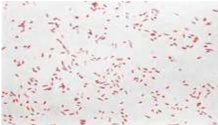
Gambar 2.1 Escherichia coli (Prasiddhanti, 2015)

Kelompok genus dari Escherichia dikelompokkan ke dalam famili Enterobacteriaceae , Escherichia coli dan bakteri fases Coliform lainnya mayoritas terdapat pada limbah dan air yang telah terkontaminasi oleh limbah. Sehingga sering terjadi infeksi pada saat menelan makanan dan minuman yang telah terkontaminasi oleh air