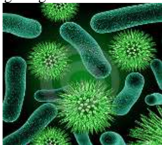
Gambar 2.3 Bakteri coliform (Rohmat Ismail, 2015)

Bakteri Coliform digunakan sebagai indicator terhadap kontaminasi Escherichia coli , sehingga membutuhkan pemeriksaan serologis spesifik terhadap Escherichia coli . Kelompok bakteri Coliform dapat dianggap sebanding dengan E.coli .