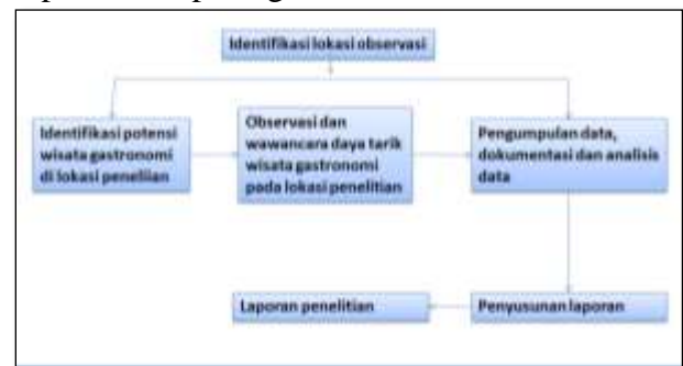
Gambar 2. Bagan Alur Penelitian

menggunakan Teknik penelitian kualitatif. Selain itu, alasan lainnya adalah karena isu yang diangkat merupakan isu yang membutuhkan adanya informasi dan pemahaman yang lebih rinci, dimana informasi dan pemahaman tersebut hanya bisa dibangun dengan cara berbicara secara langsung dengan informan, berkunjung ke lokasi penelitian, observasi lapangan, serta mendengarkan informan untuk menceritakan sejarah, keluhan kesah yang sesuai dengan isu dan literatur yang dimiliki peneliti. Alur penelitian selanjutnya dapat dilihat pada gambar berikut ini: