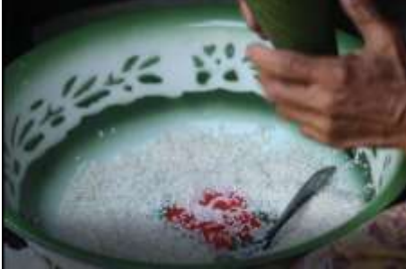
Gambar 6 Proses Pembungkusan Beras dengan Daun Pisang

dibanding jaman dulu, karena daun pisang yang sudah bersih dan sudah digunting-gunting segi empat sudah ada dijual dipasar dengan harga yang ekonomis. Diketahui harga 1 ikat daun pisang yang belum dipotong-potong dijual dengan harga Rp 1000,- per ikat dengan jumlah lembar daun (utuh) 10 lembar untuk 1 ikat.