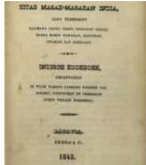
Gambar 1 Sampul Buku Kitab Masak-Masakan India Tahun 1843

Asal usul makanan Sate yang bisa dipastikan adalah bahwa makanan ini adalah makanan yang sudah tua, terbukti dari adanya buku makanan berjudul 'Kitab Masak-Masakan India Jang Tersedoet, Bagaimana Orang Orang Sadiakan