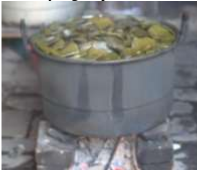
Gambar 6 Proses Masak Lontong

Selanjutnya daun tersebut mulai dilipat membentuk kerucut kemudian diisi dengan beras yang sudah dibersihkan sebelumnya. Kemudian ujung dari daun tersebut ditusuk dengan 'lidi' (Bahasa Bugis yang berarti ruas daun kelapa yang sudah dipotong-potong kecil) agar tertutup dengan rapat, sehingga terbentuklah lontong daun pisang dengan bentuk kerucut yang siap untuk dimasak.