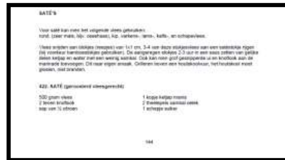
Gambar 4 Salah Satu Resep Makanan Sate pada Buku Indonesisch Kookboek Tahun 1999, Edisi ke 14

Buku ini terbit pada tahun 1999 oleh Koninklijke Marine. Dalam buku ini juga terdapat resep Makanan Sate dalam bahasa Belanda yang diabadikan pada tahun-tahun sebelum tahun 1999.