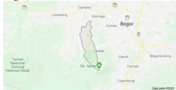
Gambar 1. Lokasi Pengabdian Masyarakat Penurunan Stunting Melalui Lingkungan Bebas Rokok Kec. Tenjolaya, Kab. Bogor.

Pengabdian masyarakat ini diselenggarakan pada hari Senin, 7 November 2022 pukul 09.00-12.00 WIB secara langsung di Balai Desa/Puskesmas setempat di Desa Cibitung, Kecamatan Tenjolaya, Kabupaten Bogor, Jawa Barat.