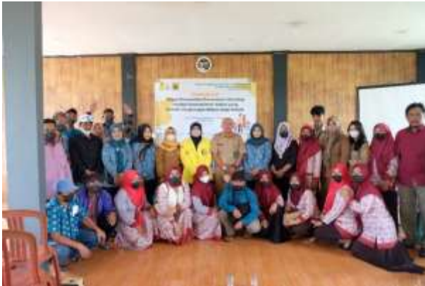
Gambar 4. Peserta Acara dan Penugasan Tokoh Masyarakat untuk Distribusi Stiker ke Rumah Warga