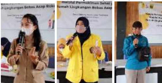
Gambar 2. Sosialisasi oleh Tenaga Ahli dari Dinas Kesehatan, Universitas Indonesia dan Pemberian Contoh Seorang Bapak dari Tenjolaya yang Tidak Merokok Sepanjang Hidupnya.

Indonesia berada di tingkat ke 4 prevalensi stunting di ASEAN (28%). Di sisi lain, prevalensi perokok anak dan dewasa masih terus meningkat. Stunting mengancam produktivitas Sumber Daya Manusia (SDM) karena adanya hambatan dalam pertumbuhan dan perkembangan anak, baik secara kognitif maupun motorik, serta pada saat berusia dewasa lebih berisiko terserang berbagai penyakit degeneratif. Konsumsi rokok berpengaruh terhadap perkonomian lokal/rumah tangga hingga nasional. Pada skala rumah tangga, rokok merupakan pengeluaran tertinggi kedua setelah makanan dan minuman jadi (Badan Pusat Statistik, 2021). Konsumsi ini berpengaruh pada daya beli makanan bergizi untuk rumah tangga yang semakin berkurang. Pada skala nasional, hal ini berpengaruh terhadap risiko keberlanjutan JKN dikarenakan keluarga perokok memiliki kepatuhan membayar iuran JKN yang lebih rendah. Selain itu, biaya kesehatan yang timbul dari rokok sebesar 27.7 Triliun Rupiah (CISDI, 2021).